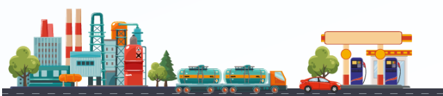
ฐานะกองทุนน้ำมันเชื้อเพลิง (ล้านบาท)