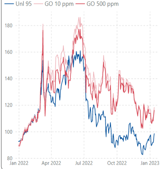
ราคากลางน้ำมันสำเร็จรูปตลาดภูมิภาคเอเชีย (เหรียญสหรัฐต่อบาร์เรล)