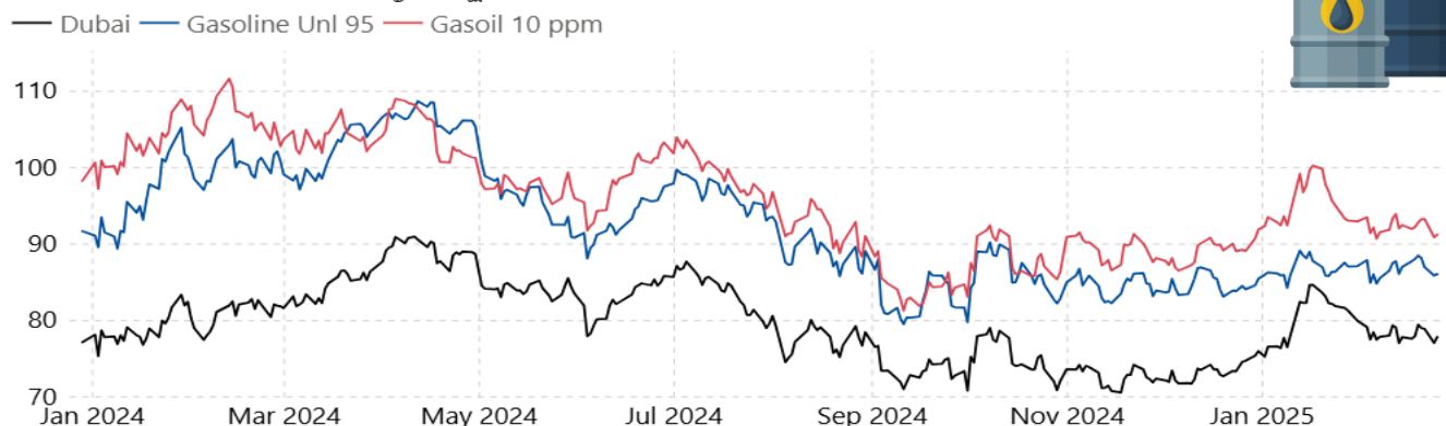
ราคาน้ำมันตลาดโลก (เหรียญสหรัฐต่อบาร์เรล)