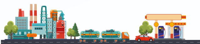
ฐานะกองทุนน้ำมันเชื้อเพลิง (ล้านบาท)