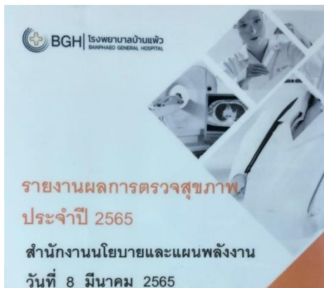
การตรวจสุขภาพประจำปี ของ สนพ. เมื่อวันที่ 8 มีนาคม 2565