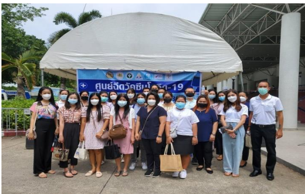
การจัดหาวัคซีนให้กับเจ้าหน้าที่ สนพ.