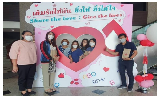
การส่งเสริมจิตสาธารณะในกิจกรรมการบริจาคโลหิต เมื่อวันที่ 25 กุมภาพันธ์ 2565