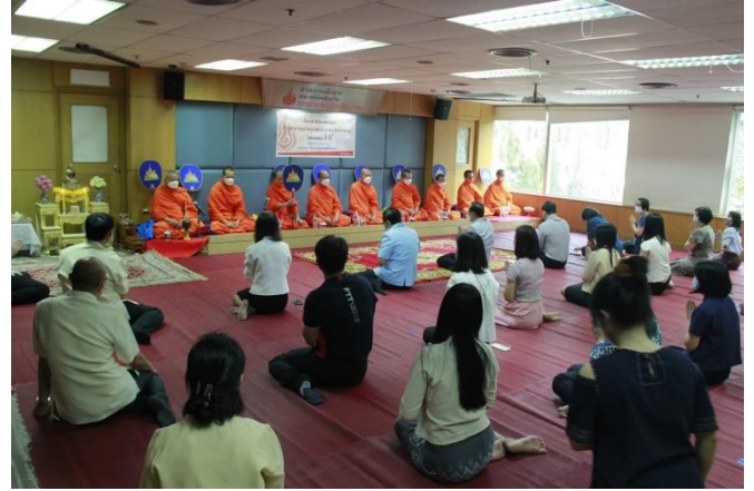
การจัดกิจกรรมบรรยายธรรม วันสถาปนา สนพ. เมื่อวันที่ 11 กุมภาพันธ์ 2565