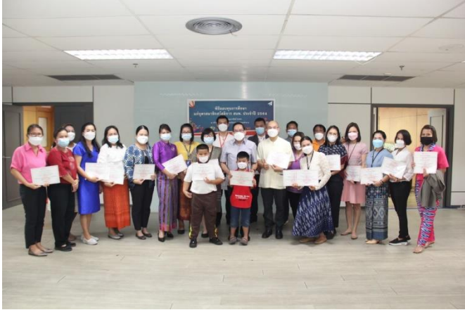
การมอบทุนการศึกษาสำหรับบุตรสมาชิก เมื่อวันที่ 11 กุมภาพันธ์ 2565