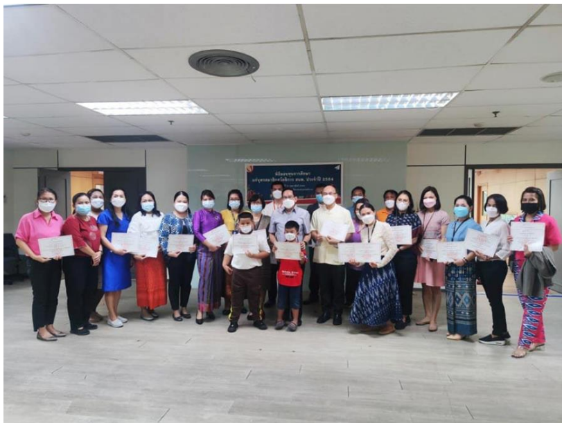
ภาพที่ 2 กิจกรรมในวันสถาปนาของ สนพ. เมื่อวันที่ 11 กุมภาพันธ์ 2565