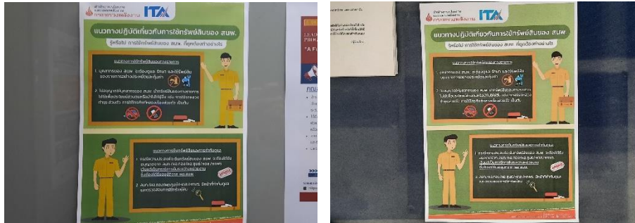
ภาพที่ 2.1.2 (2) การเผยแพร่แนวทางปฏิบัติเกี่ยวกับการใช้ทรัพย์สินของ ส.นพ.

2.1.3 i24 หน่วยงานของท่าน มีการกำกับดูแลและตรวจสอบการใช้ทรัพย์สินของราชการ เพื่อป้องกันไม่ให้เกิดการนำไปใช้ประโยชน์ส่วนตัว กลุ่ม หรือพวกพ้อง มากน้อยเพียงใด