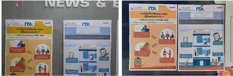
ภาพที่ 2.1.1 (2) การเผยแพร่ขั้นตอนการยืมทรัพย์สินภายใน ส.พ. และระหว่างหน่วยงานภายนอกหรือบุคคลภายนอก

2.1.2 i23 ท่านรู้แนวปฏิบัติของหน่วยงานเกี่ยวกับการใช้ทรัพย์สินของราชการที่ถูกต้อง มากน้อยเพียงใด