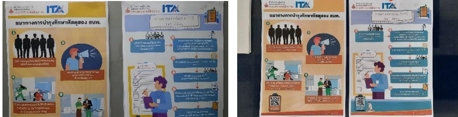
ภาพที่ 2.1.3 (2) การเผยแพร่แนวทางการบำรุงรักษาพัสดุของ สทพ. และขั้นตอนขั้นตอนการตรวจสอบพัสดุของ สทพ.