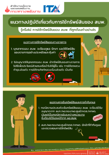
ภาพที่ 2.1.2 (1) แนวทางปฏิบัติเกี่ยวกับการใช้ทรัพย์สินของ ส.พ.

สนพ. ได้จัดทำแนวทางปฏิบัติเกี่ยวกับการใช้ทรัพย์สิน เรื่อง แนวทางปฏิบัติเกี่ยวกับการใช้ทรัพย์สินของ ส.พ. ที่ถูกต้อง ในรูปแบบ infographic รายละเอียดปรากฏตามภาพที่ 2.1.2 (1) พร้อมทั้งได้ดำเนินการเผยแพร่แนวทางดังกล่าวเมื่อวันที่ 5 เมษายน 2566 ผ่าน 3 ช่องทาง ได้แก่ 1) แจ้งเวียนทางอีเมลของบุคลากรของหน่วยงาน 2) บริเวณลิฟต์ภายใน สนพ. และ 3) บอร์ดประชาสัมพันธ์ภายใน สนพ. รายละเอียดปรากฏตามภาพที่ 2.1.2 (2)