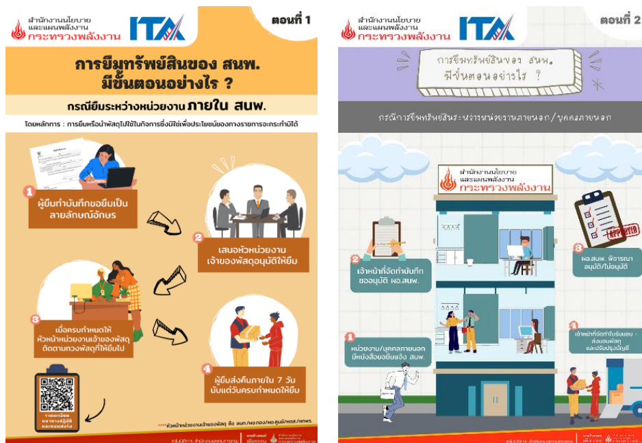
ภาพที่ 2.1.1 (1) ขั้นตอนการยืมทรัพย์สินภายใน สนพ. และระหว่างหน่วยงานภายนอกหรือบุคคลภายนอก

สนพ. ได้จัดทำแนวทางปฏิบัติเกี่ยวกับการใช้ทรัพย์สิน เรื่อง ขั้นตอนการยืมทรัพย์สินภายใน สนพ. และการยืมทรัพย์สินระหว่างหน่วยงานภายนอกหรือบุคคลภายนอก ในรูปแบบ infographic รายละเอียดปรากฏตามภาพที่ 2.1.1 (1) พร้อมทั้งได้ดำเนินการเผยแพร่แนวทางดังกล่าวเมื่อวันที่ 27 กุมภาพันธ์ 2566 ผ่าน 3 ช่องทาง ได้แก่ 1) แจ้งเวียนทางอีเมลของบุคลากรของหน่วยงาน 2) บริเวณลิฟต์ภายใน สนพ. และ 3) บอร์ดประชาสัมพันธ์ภายใน สนพ. รายละเอียดปรากฏตามภาพที่ 2.1.1 (2)