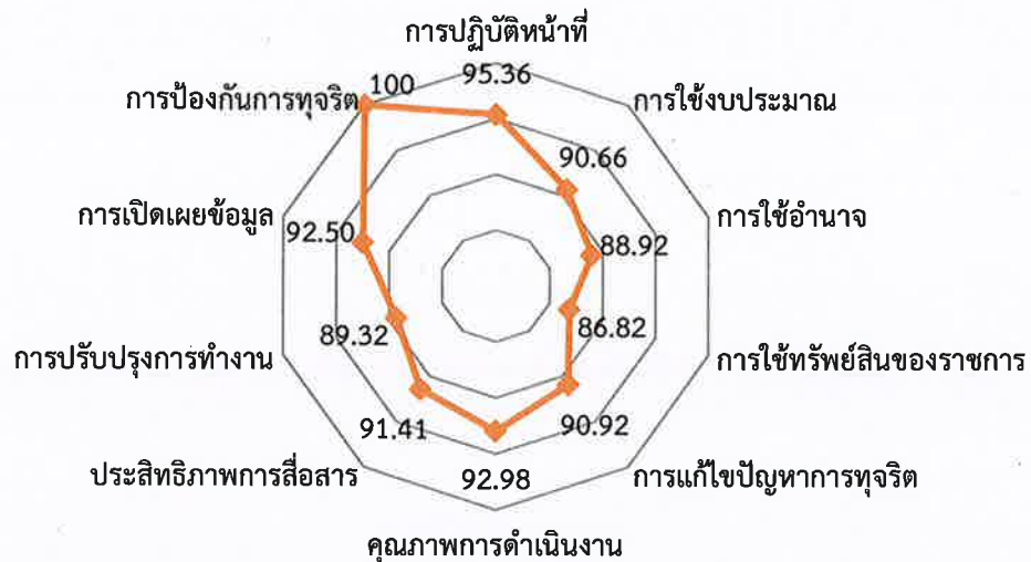
ภาพที่ 2 สรุปภาพรวมผลการประเมินคุณธรรมและความโปร่งใสในการดำเนินงาน